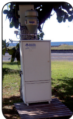
SITE DE BELLEFONTAINE