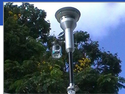
Tête de prélèvement au dessus d'une station de mesure fixe.