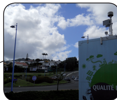
SITE «ROND-POINT QUATRE CROISÉES»