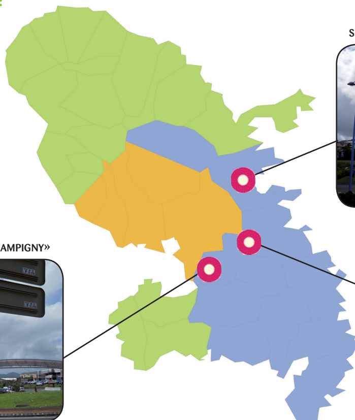
SITE «STATION TRAFIC DU ROBERT»