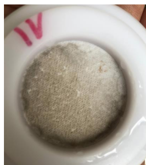
Filtre de particules PM10 prélevé le 15/04/2021

Madininair a lancé des prélèvements de particules PM10 sur filtre. Ces prélèvements permettent notamment de visualiser la couleur des poussières de 10\mu\text{m} de diamètre prélevées et ainsi de qualifier visuellement les sources potentielles. On peut observer que le filtre du 15/04/21 présente une couleur légèrement gris clair pouvant illustrer un mélange avec une majorité de brume de sable (couleur ocre) et à bien moindre mesure de cendres volcaniques (gris/noir).