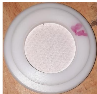
Filtre de particules PM10 prélevé le mercredi 21/04/21

Madininair a lancé des prélèvements de particules PM10 sur filtre. Ces prélèvements permettent notamment de visualiser la couleur des poussières de 10µm de diamètre prélevées et ainsi de qualifier visuellement les sources potentielles. On peut observer que les filtres ne montre aucune influence particulière de cendres (couleur gris/noir).