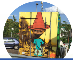
Polluant.s déterminant.s des indices ATMO

BILAN DES INDICES ATMO AU COURS DU TRIMESTRE