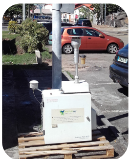
SITE DE «BELLEFONTAINE»