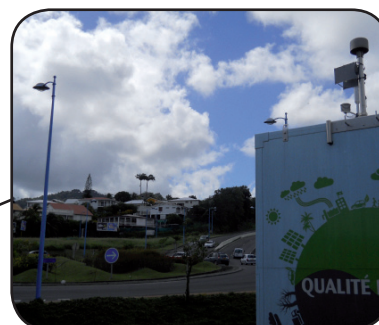
SITE «ROND-POINT QUATRE CROISÉES»