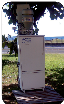
SITE DE BELLEFONTAINE