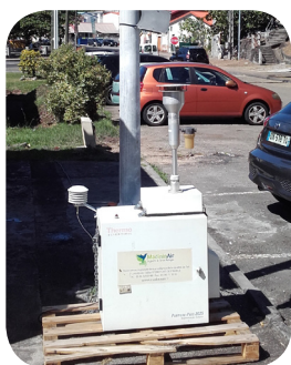
SITE DE «BELLEFONTAINE»