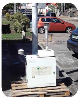
SITE DE «BELLEFONTAINE»