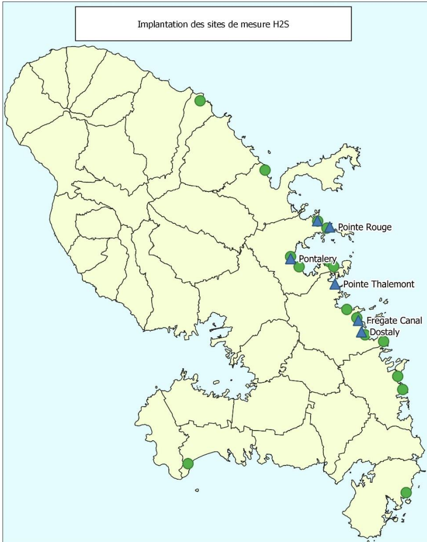
CONCENTRATIONS MOYENNES EN H 2 S SUR 24H DE 12h A 12h (EN PPM) RELEVÉES DU 13/02/2023 AU 20/02/2023

En complément du réseau de surveillance continue assurée par les dispositifs Cairpol, des appareils Dräger X-am 5000 peuvent être utilisés pour des mesures complémentaires en hydrogène sulfuré . Ces appareils peuvent, par exemple, être utilisés pour évaluer l'exposition à diverses distances au littoral, baliser une zone lors d'épisodes d'échouage massifs, etc.